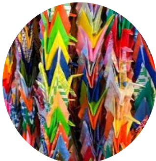
写真(しゃしん)はイメージ

京丹後市立大宮第一小学校が児童会を中心とした「笑顔の千羽鶴」活動として、新型コロナウイルスで学校が休校中に自分たちが今何ができることなのかを考(かん)えて、新聞で見た舞鶴市での「黄色いハンカチ」をヒントに「当たり前の日常が戻るように」と願い、千羽鶴1300羽を折り京丹後市役所大宮庁舎の職員の方に渡し、自分たちの願いを託(たく)しました。そして、その千羽鶴は、大宮庁舎内に飾られ、来庁者にも折ってもらえるように、折り紙を置きました。